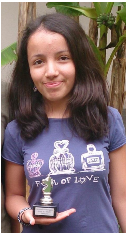
Triumph an der Mädchenmeisterschaft in Ascona